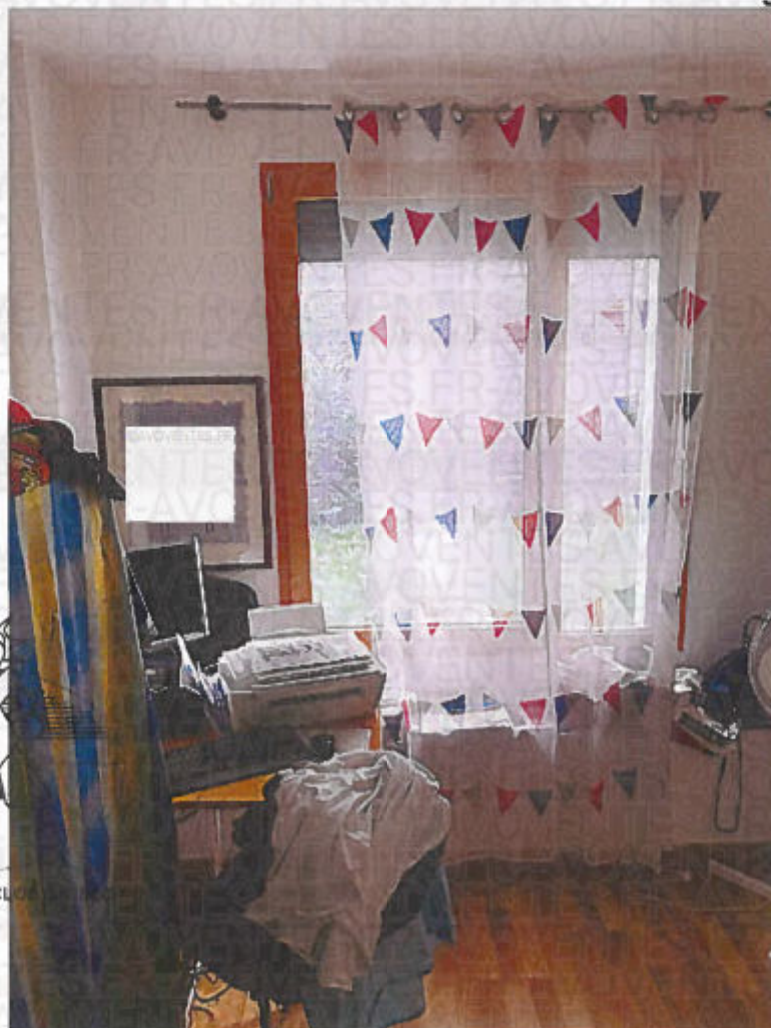
Photographie n° 18