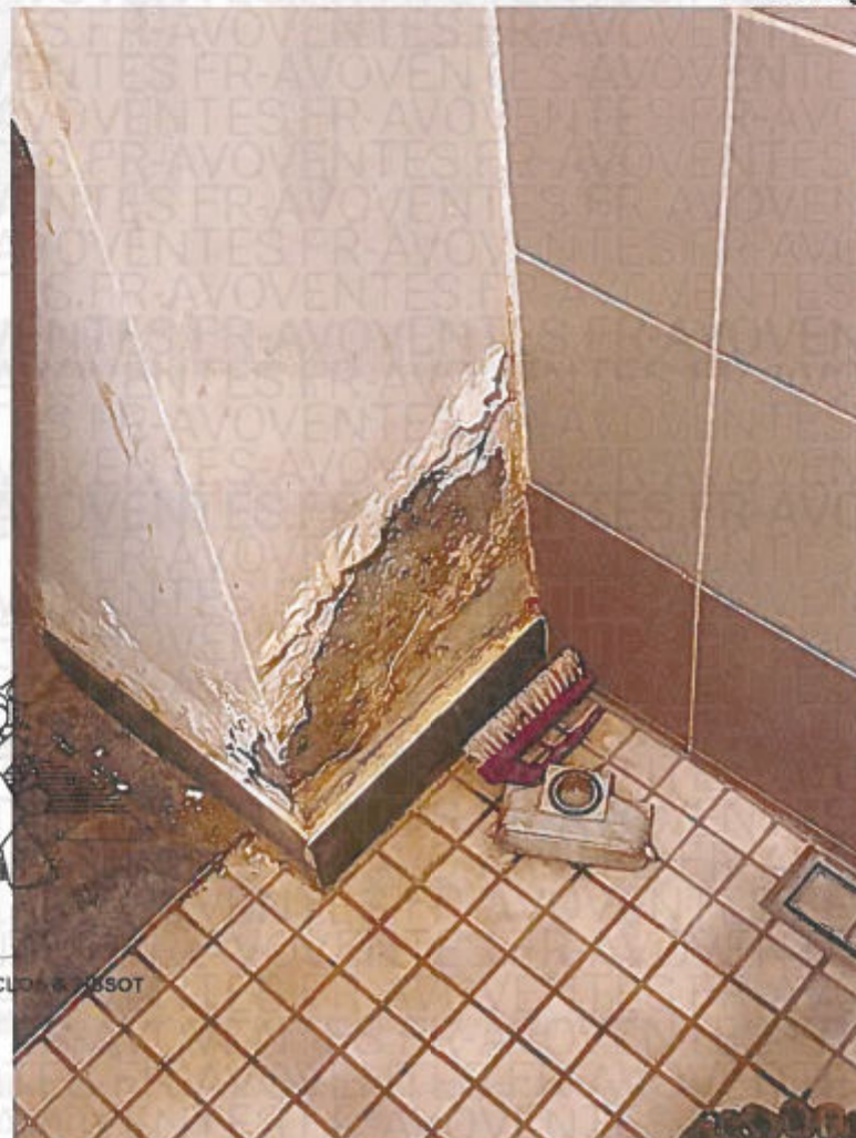
Photographie n° 22