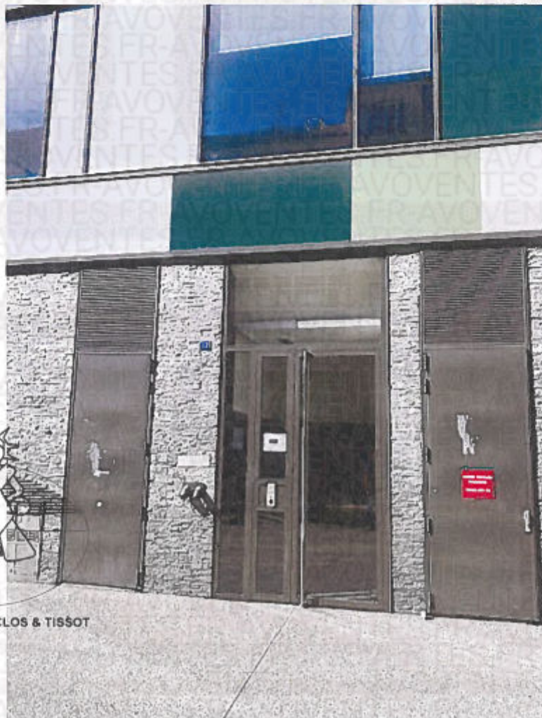
Photographie n° 4