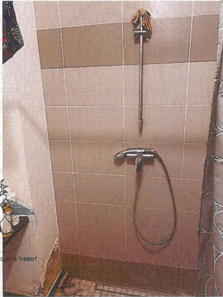
Photographie n° 21