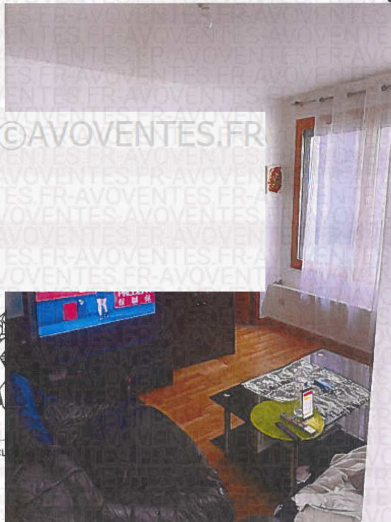
Photographie n° 10