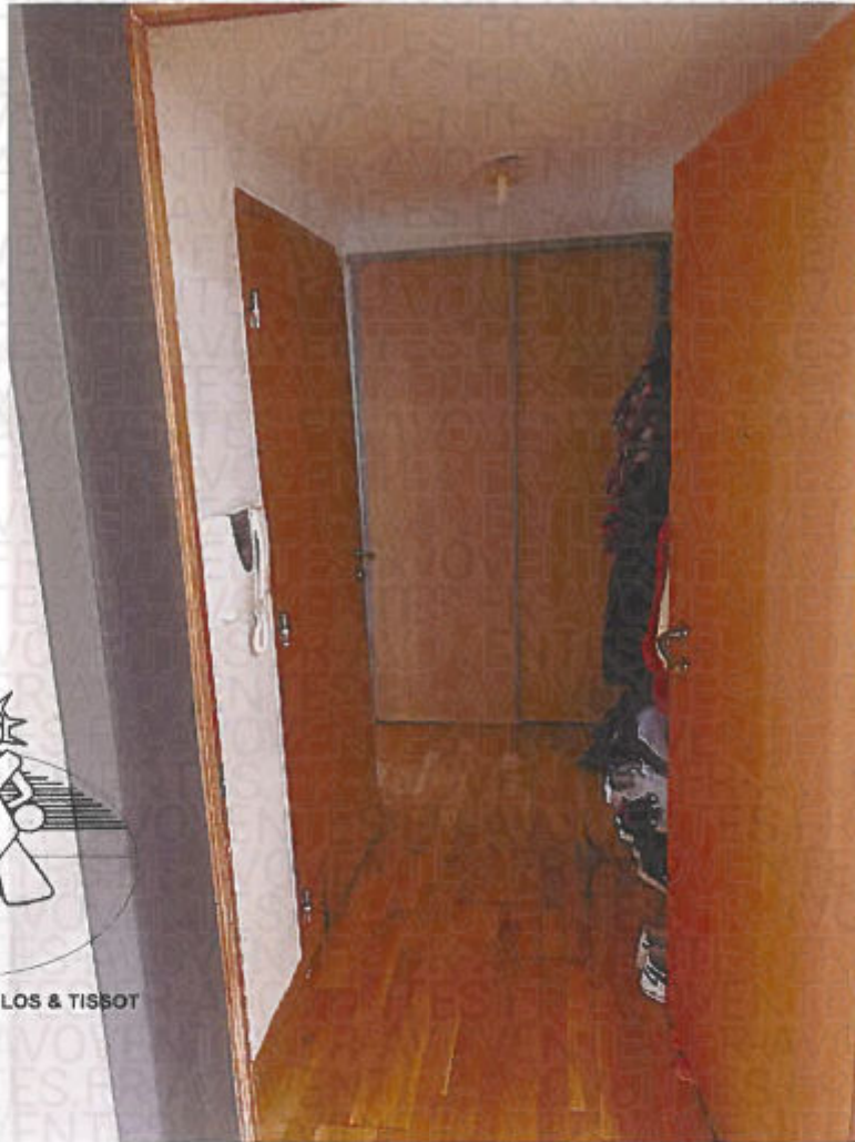
Photographie n° 5