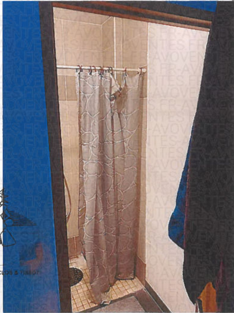
Photographie n° 19