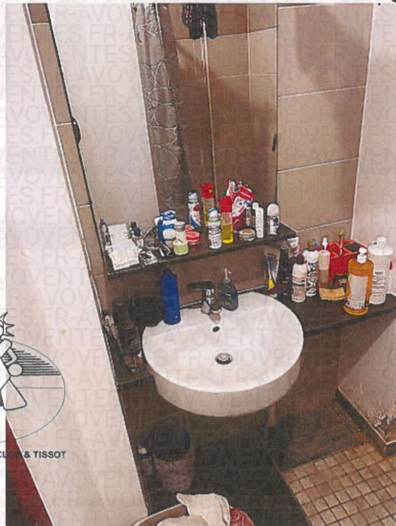
Photographie n° 20