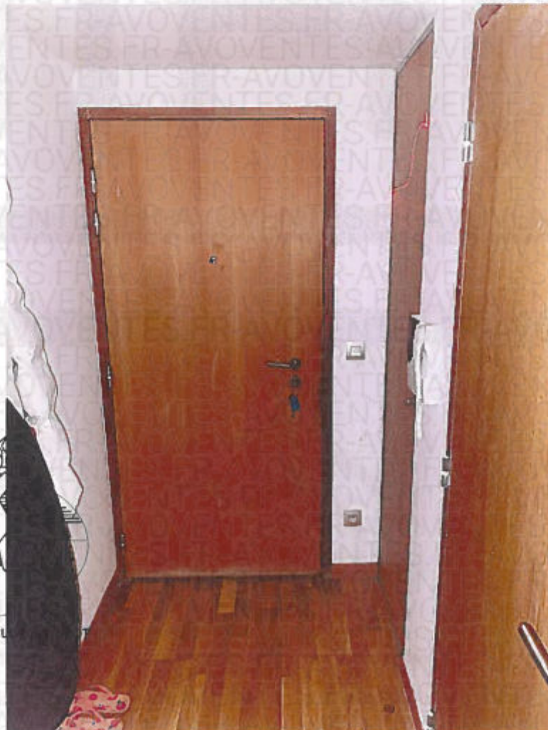
Photographie n° 6