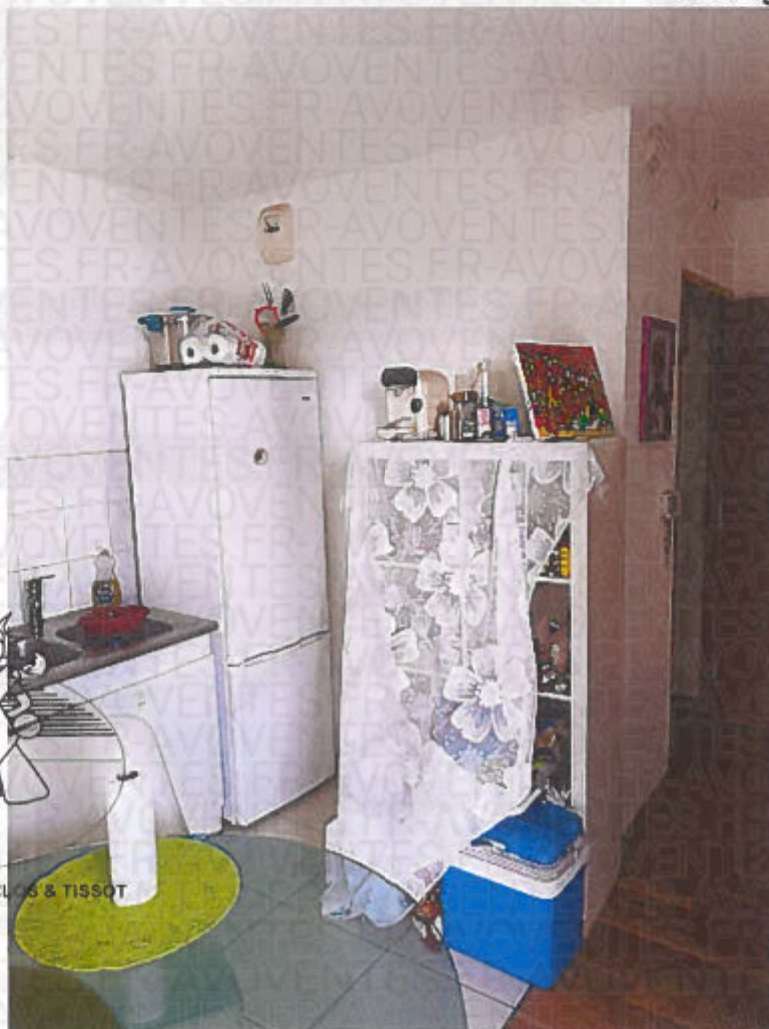
Photographie n° 14